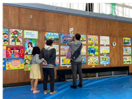
写真：ニコニコふれあいバス記念感謝デー

このような取り組みは、地域の活性化にも寄与するものと考えます。新たな地区での協議会の組織づくりや新しい公共交通の運行に向けた地域の取り組みを支援します。