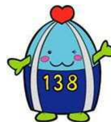
一宮市マスコットキャラクター「いちみん」