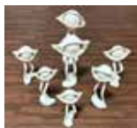
「メッセージン君たち」2025 鈴木瑞祥

長い時を経てきた旧林家住宅と庭園で芸術作品を展示することで、過去・現在・そして未来へと想いを馳せ、空間の中で互いに理想を追求する姿を表現します。会期中には音楽イベントも予定しています。