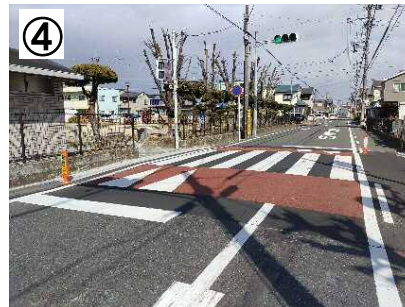
スムーズ横断歩道