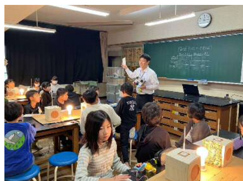
緑のカーテン講座の受講