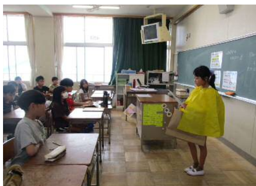
回収したリサイクル紙の重さを発表