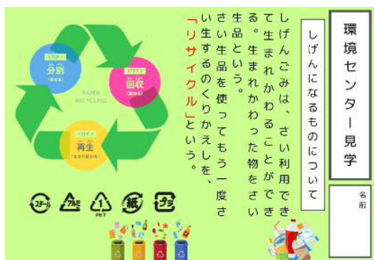
ごみについての調べ学習