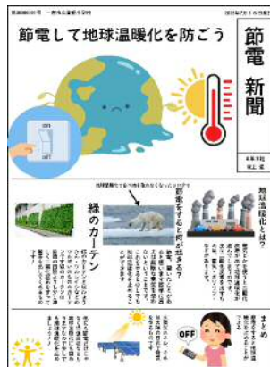
節電についての掲示物を作成