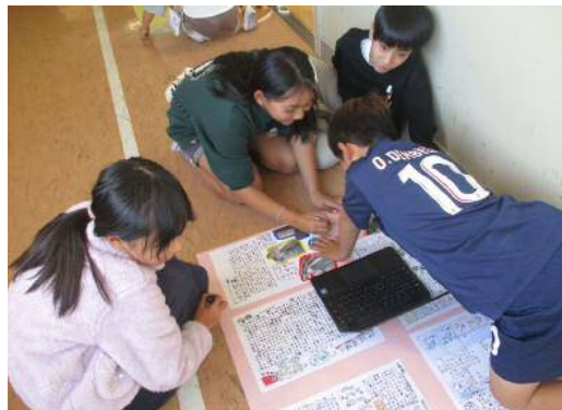
グループで壁新聞を作成