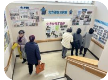
北方町出張所の階段踊り場にも展示されました！