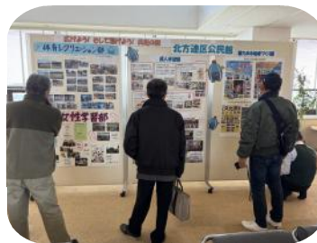
他の地域の方が参考にされています

1月17日に尾西生涯学習センターで一宮市公民館全体研究集會が開催されました。その中で、小信中島連区と北方町連区が、公民館活動のパネル展示で日頃の活動を報告しました。他地区でも北方の取り組みが参考にされているようで、ちょっぴり自慢ですね。今年度もいろいろな公民館活動に参加してあげたいものです。