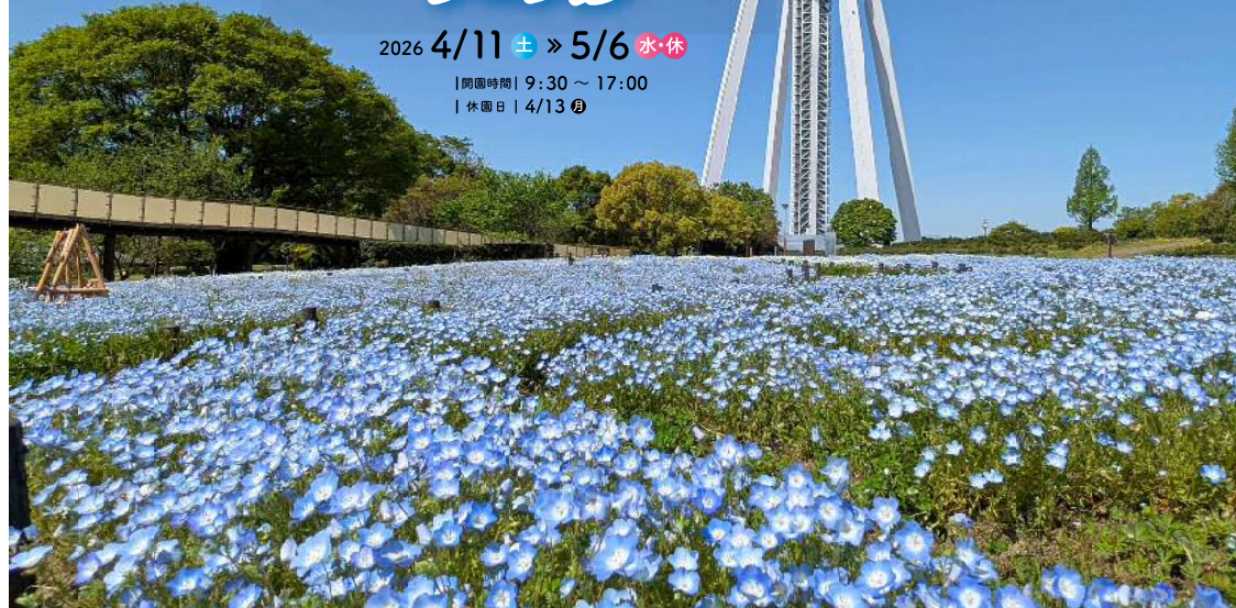
主催：国営木曾三川公園 三派川地区センターイベント実行委員会