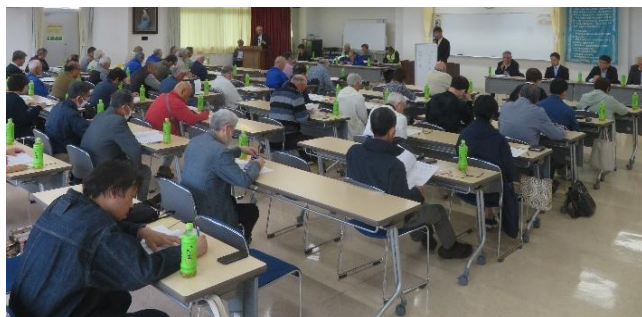
大和防犯パトロール委員会総会