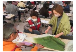
風呂敷リュック作り