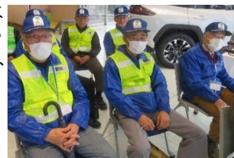
大和防犯パトロール隊員

一宮警察署主催の『スマホ連動型防犯カメラ、GPSを発信器を使用して車の盗難防止と防犯装置』講習会に委員会の代表が参加しました。2025年1月~6月の全国自動車盗難件数は約2,400件。前年と比べ減少傾向にありますが、依然と深刻な問題です。盗難車両の発生場所は、一般住宅が最も多く、2024年は全体の42.9%です。盗難多発県は「独立型の電子制御防犯機器・警報機・GPSの装備」を推奨しています。また、短時間でも車両から離れる時も、完全に窓を閉め、必ずキーを抜きドアロックをする。自宅駐車場には防犯カメラやセンサーライトを設置する。等々と呼びかけています。