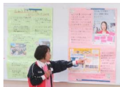
奉仕団の活動実践

赤十字の人道・博愛の精神に基づき、地域をより良くするための活動実践する奉仕団(ボランティアグループ)の皆さんから、避難生活に役立つ技術を受講しました。参考資料：日本赤十字社