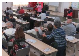
リラクゼーション