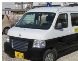
青色防犯パトロール車