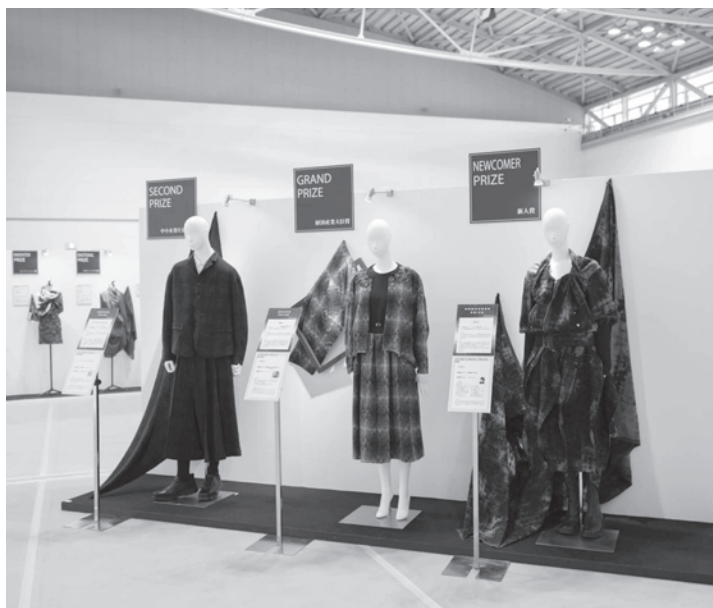
第23回 JAPAN YARN FAIR & THE BISHU ～糸と尾州の総合展～ (2月19日・20日)