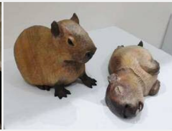
田代雄一「動物彫刻」