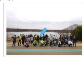
サイクリングイベント『自転車×カフェ』