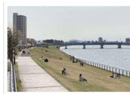
信濃川やすらぎ堤の高水敷 (2019年かわまち大賞受賞地区)