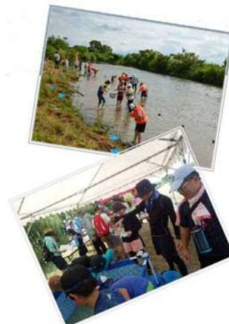
木曽川ミズへの勇者たち