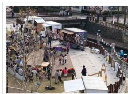
大垣市かわまちテラス（岐阜県大垣市）

例：関係機関への許認可申請のサポート 都市・地域再生等利用区域の指定 河川敷の占用申請・許可