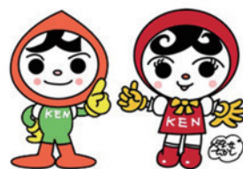
人権イメージキャラクター 人KENまる君 人KENあゆみちゃん

人権擁護委員は、人権に関する啓発活動を行ったり、地域の皆さんから人権相談を受け問題解決のお手伝いをしたりしています。