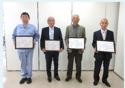
善行者表彰された皆さん（一般の部）