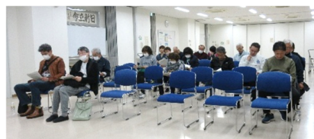
熱心に審議する出席者の皆さん