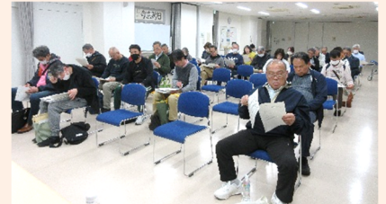
熱心に審議する出席者の皆さん