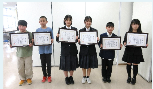
善行者表彰された皆さん（児童・生徒の部）